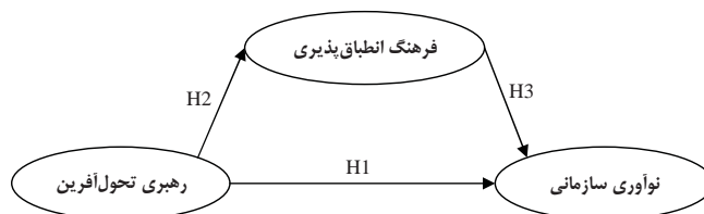
شکل ۱- الگوی مفهومی تحقیق

H۴: فرهنگ انطباق‌پذیری اثر میانجی‌گری مثبت معنادار بر رابطه‌ی میان رهبری تحول‌آفرین و نوآوری سازمانی در شرکت‌های جامعه هدف دارد. با توجه به توضیحات فوق، الگوی مفهومی تحقیق حاضر مطابق شکل ۱ می‌باشد: